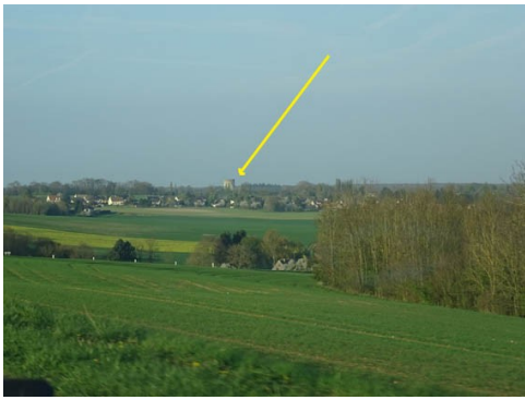
Le donjon vu du Sud