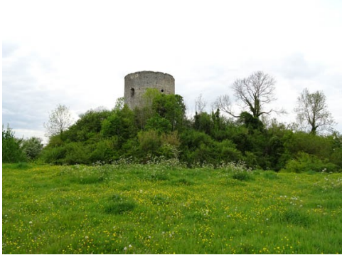
Le donjon vu de près