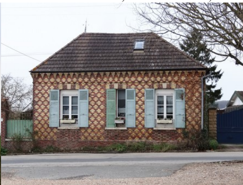
Une maison en briques polychromes