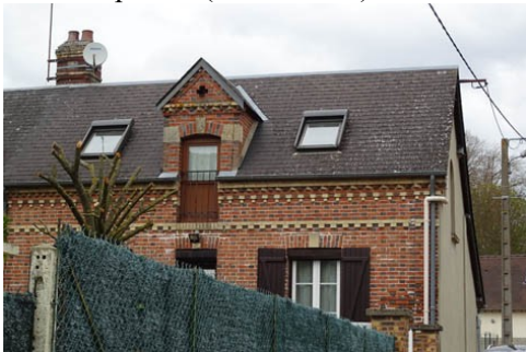
Maisons du village