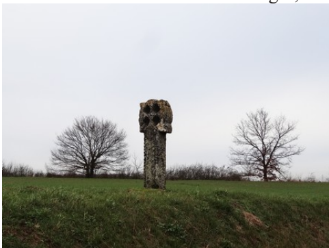
La croix percée (inscrite MH)

Pour le reste du périmètre de 500m Les avis seront cohérents avec ceux émis ces dernières années, à savoir : pas de maisons à volume compliqué (type V, W, Y, ou Z), pentes à 45° pour les volumes principaux, ardoise ou tuile plate de teinte brun vieilli, à 20u/m 2 , avec un débord de toiture de 20cm, enduit de teinte beige clair avec modénatures (au choix : chaînages, encadrement de fenêtres, soubassement, colombage...). *Voir les autres fiches.