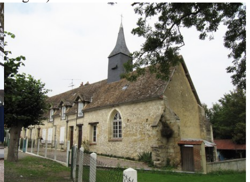
Une église reconvertie en habitation