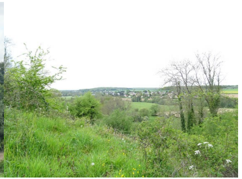
Vue vers le nord-ouest