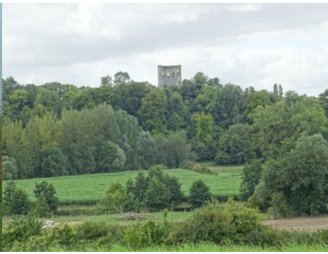
Une vue lointaine depuis le Nord